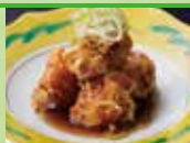
和風油淋能登河豚