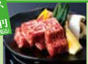
厳選和牛ロース陶板焼き