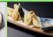
北陸鶏天婦羅 自家製あられ添え