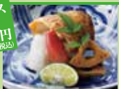
のどぐろ半身塩焼