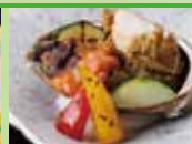
鮎と地野菜麹味噌焼