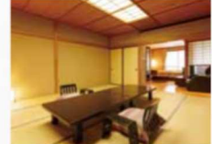
風の棟 スーベリア客室