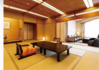
星の棟 デラックス客室