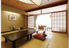
月の棟 スタンダード客室