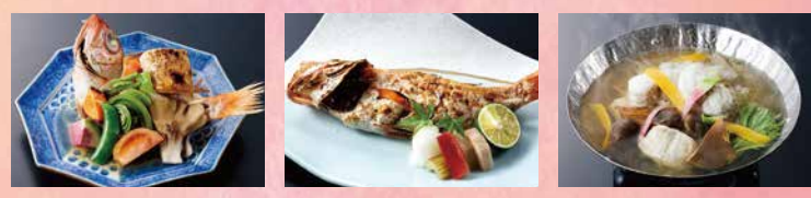
炙りのどぐろの加賀五菜蒸し のどぐろ塩焼き 能登河豚鍋