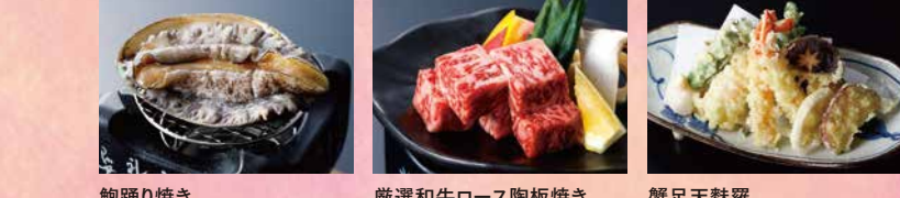
鮑踊り焼き 厳選和牛ロース陶板焼き 蟹足天麩羅